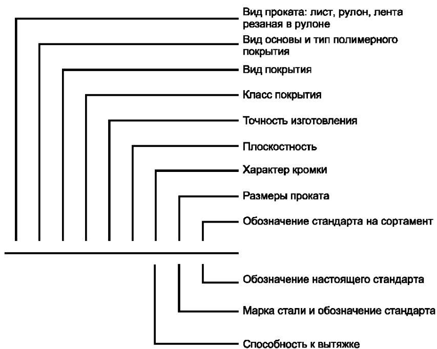
Схема условных обозначений проката с полимерным покрытием

Примечание — При отсутствии какого-либо из параметров его выбирает предприятие-изготовитель.